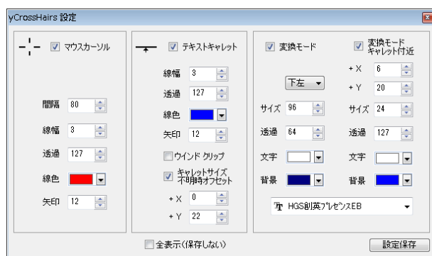
図 3 設定ダイアログ

数値入力箇所にキーボードから直接数値入力した場合、フォーカスを失ったときに反映します。 (TAB キーやマウスクリックで別の操作箇所に移動したとき)